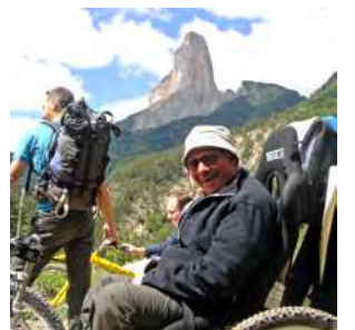
Trièves toujours terre d'accueil Page 3