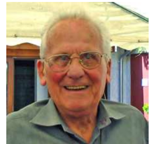
pour continuer l'action d'Edmond Gauthier Page 2