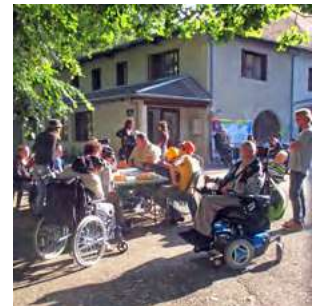
du nouveau pour les séjours à l'Ermitage Page 8

Pour nous aider, un bon pour don ou cotisation est disponible à l'intérieur du journal. Merci d'avance.