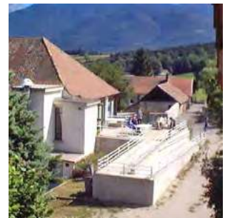
une nouvelle vie pour la Villa Cayeux Pages 4 & 5