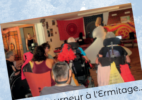
Derviche tourneur à l'Ermitage...