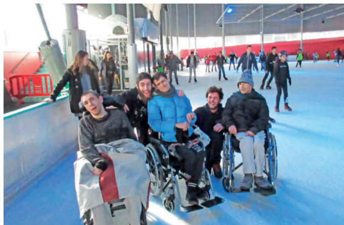
...ou sortie avec les copains