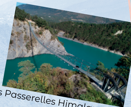
Les Passerelles Himalayennes...