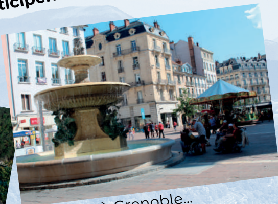
Escapade à Grenoble...