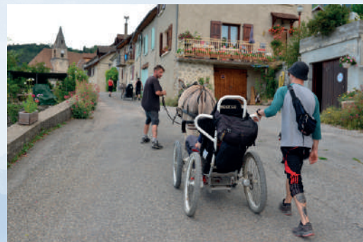
Découverte des villages triévois...