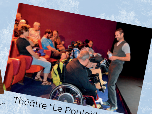
Théâtre "Le Poulailler"...