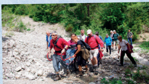
Randonnée en Joëlette...