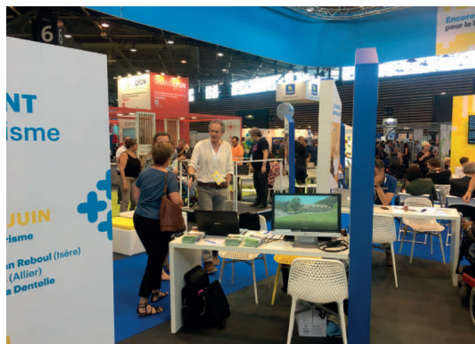
au salon de Lyon

Nous avons participé cette année à 2 salons dédiés au handicap, de façon à mieux faire connaître l’association et l’Ermitage dans le quart sud-est de la France. Nous étions donc présents au salon Autonomic de Marseille les 22 et 23 novembre 2018. Notre stand a intéressé de nombreux visiteurs, particuliers et professionnels (représentants d’associations mais aussi de structures) ; plusieurs contacts ont été pris. Nous avons ainsi pu constater que la localisation de notre centre, en moyenne montagne, en pleine nature et proche de Marseille, mais aussi les activités variées que nous proposons à chaque séjour, sont des atouts importants ! Les 5 et 6 juin 2019, nous participions également au salon Handica de Lyon, sur le stand de la Région Auvergne-Rhône-Alpes. Là encore, nous avons noté une forte demande pour des séjours de vacances. Les élus de la Région, rencontrés à cette occasion, ont manifesté de l’intérêt pour notre structure.