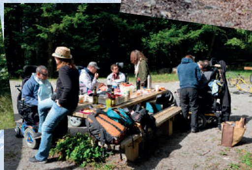
Balade et pique-nique dans nos montagnes...