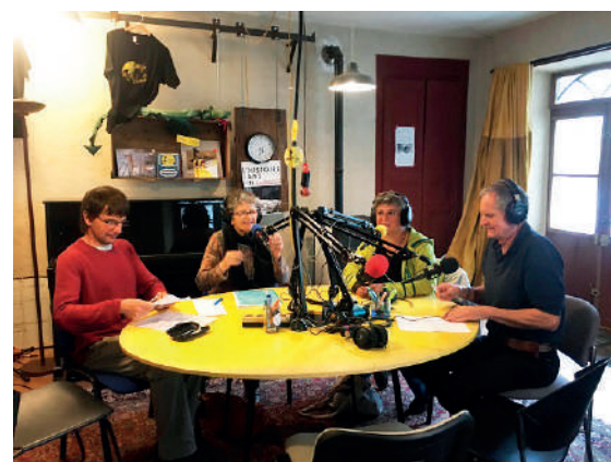
RadioDragon à l'Ermitage

Pour se faire mieux connaître, nous avons mis en place plusieurs actions. Nous étions présents sur les salons dédiés au handicap à Marseille et à Lyon ; un article y est consacré dans le journal. La radio locale Radio Dragon nous a interviewé ; vous retrouverez le lien vers l'émission sur la page « actualités » du site internet. Un reportage sur l'association a été publié dans « L'handispensable, le Mag' » de juin 2019, journal voué au handicap (Grrr...Art Editions).