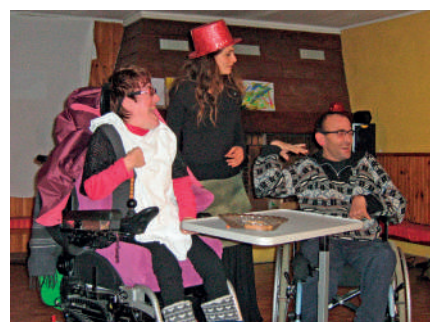
...des animations culturelles