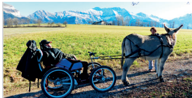
...des sorties nature