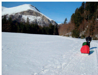
...des moments simples à partager